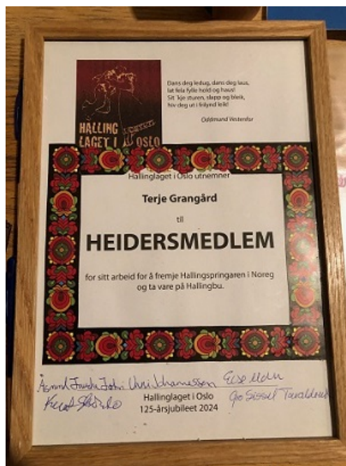
Diplomet som heidersmedlem !

Leve Hallinglaget og Nordahl Bruns gate 22!