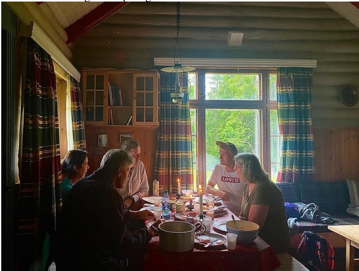
Stemming på Hallingbu – på ein spikjikkjøttur for nokre år sidan ...