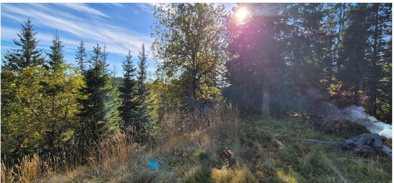
Utsikt frå Hallingbu, mot sør ... Sola glimrar og skogen veks til ...