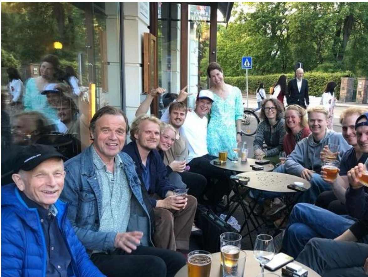
Mange tok ei øl etter ekstraøvinga 19. juni 2024. Me var klare for Kappleik på Gol!