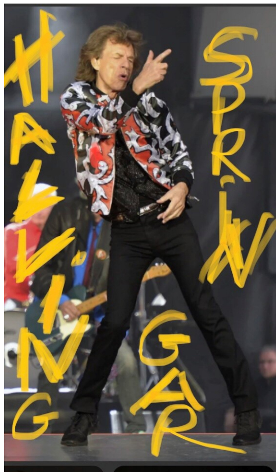
Det er mange som liker hallingspringar.