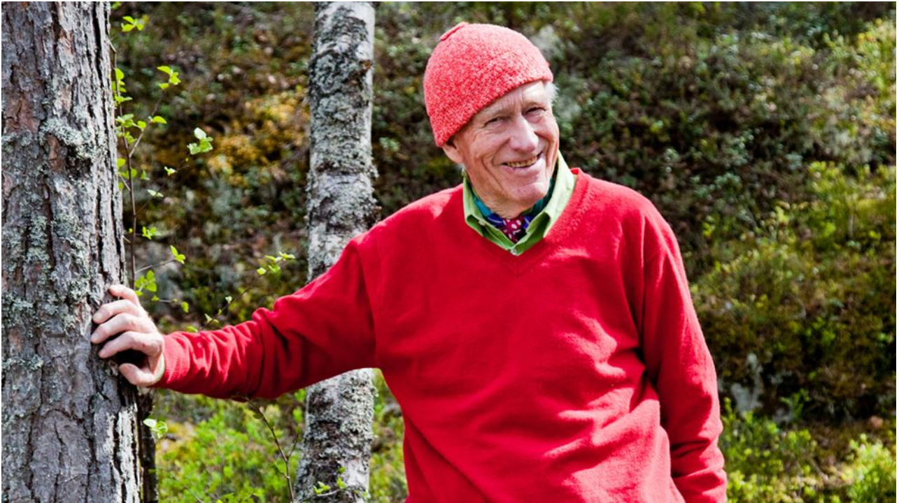
Hallinglaget lyser fred over Olav Thon sitt minne...

Olav gjekk bort 16. november og hadde ein storslagen bisetting i ei fullsett Oslo Domkyrkje den 27. november! Olav var det næraste ein kan kome til å være æresmedlem i Hallinglaget! Seinast i 2021 sendte Olav heile 50 tusen kroner til Hallinglaget som skulle brukast til vedlikehald av Hallingbu, Me i Styret i laget sette utruleg stor pris på at han såg oss i si travle kvardag! Det er mange som vil sakne Olav som alltid hadde nokre gode ord å dele.